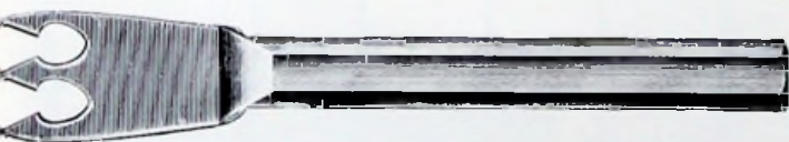
No. 6A Patent-Fitsenbeitels.